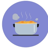
ТЕРМИЧЕСКАЯ ОБРАБОТКА ПРОДУКТОВ