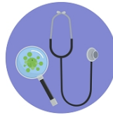
ВЫЗОВ ВРАЧА ПРИ НАЛИЧИИ СИМПТОМОВ