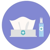
ПРОТИРАНИЕ ПОВЕРХНОСТЕЙ МЫЛЬНЫМ РАСТВОРОМ ИЛИ АНТИСЕПТИКОМ