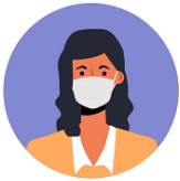
САМОИЗОЛЯЦИЯ И ИСПОЛЬЗОВАНИЕ МАСКИ ПРИ СИМПТОМАХ