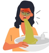
ТОШНОТА И СЛАБОСТЬ